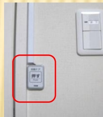
有線タッチスイッチ